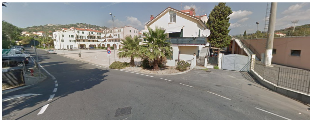
Cancello lato sud dietro tribune.